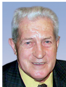
Szarka Károly 1934–2011