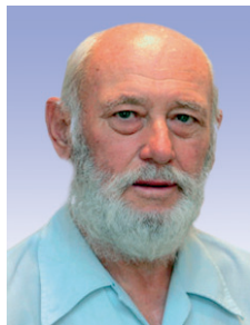
Németh Pál 1937–2009