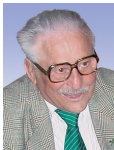
Füzessy József 1915–2006